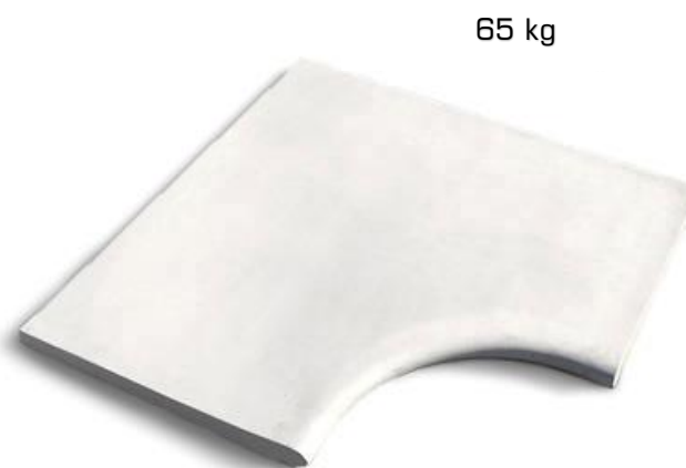
debljina elementa od 20 do 50 mm

NAPOMENA : Tehnički list proizvoda sadrži naša znanja i praktična iskustva. Svim korisnicima koji upotrebljavaju naše proizvode, treba poslužiti kao preporuka za primjenu istih kako bi se postigli najbolji rezultati. Istovremeno, firma BEPRO d.o.o. ne preuzima odgovornost za štetu nastalu uslijed nepravilne upotrebe, nekvalitetno izvedenih radova ili pogrešnog odabira proizvoda